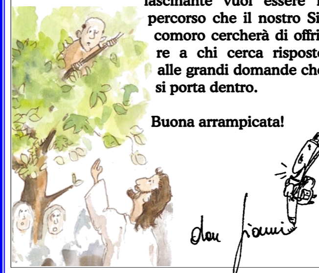
Immagine certamente affascinante, come affascinante vuol essere il percorso che il nostro Sicomoro cercherà di offrire a chi cerca risposte alle grandi domande che si porta dentro.

Ecco il perché di questo nuovo foglio che offriamo alle famiglie che stanno accompagnando figli a catechismo (e non solo a loro): porgere dei piccoli rami su cui poter salire per ascoltare, riflettere, pregare, incontrare persone capaci di gesti disarmanti... Occorre a volte stare un po' al di fuori della folla stereotipa, come quella che di fatto impediva a Zaccheo di vedere Gesù. Nella massa ci sono persone che si distinguono e hanno la capacità di far vedere le cose da un punto di vista differente, come potrebbe succedere salendo su un grande albero.