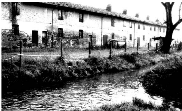
Particolare di una cascina: abitazioni per braccianti agricoli e loro familiari

Alcune contengono veri e propri gioielli: Conigo, con il santuario di Santa Maria Nascente, la chiesa più antica del no-