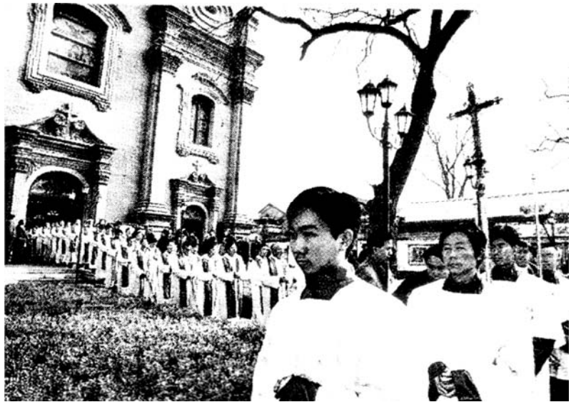
IN PROCESSIONE Religiosi cinesi escono da una chiesa cattolica di Pechino

della Chiesa «sotterranea», composta dai cattolici fedeli al Papa che non aderiscono all'Associazione patriottica cattolica cinese, cioè alla Chiesa che accetta l'autorità del Partito comunista e non quella del Vaticano; inoltre, lo scorso 1° settembre, la polizia ha demolito con i bulldozer la chiesa cattolica di un villaggio, appena costruita con le offerte raccolte dalla povera gente delle campagne con indicibili sacrifici. Di ben tre vescovi, arrestati in Cina nell'ultimo decennio, non si hanno più notizie e l'agenzia Asia News , in un dossier del 2005, riferisce di una ventina di vescovi e altrettanti sacerdoti in carcere o agli arresti domiciliari; frequentissima, poi, la carcerazione di manifestanti che protestano in difesa del clero.