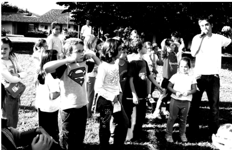
Lo staff dell'Oratorio

istantanea dell'8 ottobre scorso "scattata" all'Oratorio di Santa Corinna verso le 16.30 di quel pomeriggio riscaldato da un piacevole sole d'autunno. È così che si vivono momenti semplici e belli capaci di regalare il gusto di essere, se lo vogliamo, parte di una grande famiglia. Chissà se rimarranno momenti rari o se il desiderio ne saprà creare di altri. Di sicuro un nuovo anno oratoriano è iniziato. Buona avventura!