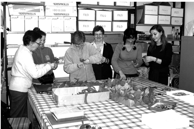
Nel laboratorio della Casa Pampuri: preparazione per il Natale