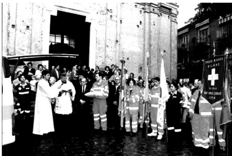
Benedizione di una nuova ambulanza a Binasco

Oltre all'apprendimento di tecniche, si fa esperienza di gruppo: l'equipaggio è un gruppo di lavoro che, radunato attorno a un comune obiettivo, deve coordinarsi e rag-