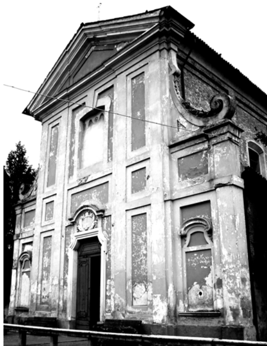
La chiesa di San Michele in Mairano

Il reddito del beneficio parrocchiale nel 1620 era di oltre 80 scudi,