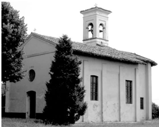
L'oratorio di San Rocco a Tavernasco

Dopo l'ampliamento, la chiesa misurava circa 14,20 m in lunghezza, con una larghezza di m 6,82 e un'altezza di m 5,04. Dalle misure indicate, si evince che l'edificio descritto non corrisponde all'attuale chiesa di Mairano, anche in relazione all'orientamento verso est, opposto a quello dell'odierna