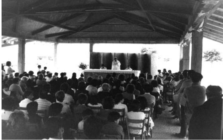
Giugno 1984. La prima Messa celebrata nel salone dell'oratorio non ancora terminato

Ricorre quest'anno il ventennale dell'inaugurazione del salone dell'oratorio alla cui costruzione hanno partecipato molte persone della comunità di Santa Corinna e un amico ha voluto ricordare così quel periodo