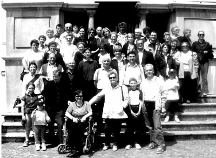
Santuario di Crea. Il gruppo dei pellegrini

È seguita la S. Messa nella bella chiesa gremita di pellegrini: una celebrazione in cui si è avvertito il senso e la bellezza di essere comunità cristiana, dove la preghiera del singolo diventa preghiera di tutti, insieme si ringrazia e si loda Dio e ci si affida a Maria per essere da lei condotti a Gesù. Terminata la S. Messa ci si è ancora soffermati nel Santuario: nella cappella della Madonna, per pregare davanti alla gotica statua lignea della Vergine con il Bambino , antica e venerata immagine che da secoli guarda benignamente i pellegrini; nella cappella di Santa Margherita con i preziosi affreschi del Quattrocento che raccontano la vita e il martirio della Santa; nel corridoio di fianco alla chiesa colmo di ex voto , che testimoniano la riconoscenza dei fedeli alla Madonna di Crea per le innumerevoli grazie ricevute.