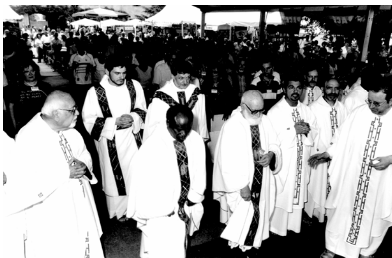
Festa dei missionari Cappuccini. Il momento della S. Messa