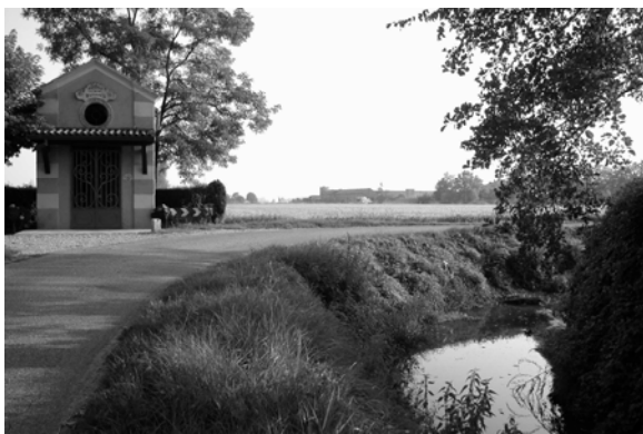
La Cappella della Madonna di Lourdes a Noviglio e sulla destra una roggia e una riva

bene prezioso e utile, possa arrivare dappertutto nel modo giusto e nella quantità giusta per essere causa di vita e non di rovina o di morte occorre una grande cura dell'uomo. Molto importante infatti è il compito degli agricoltori che ogni giorno controllano il flusso e il livello dell'acqua; controllano le rive che sono il mezzo